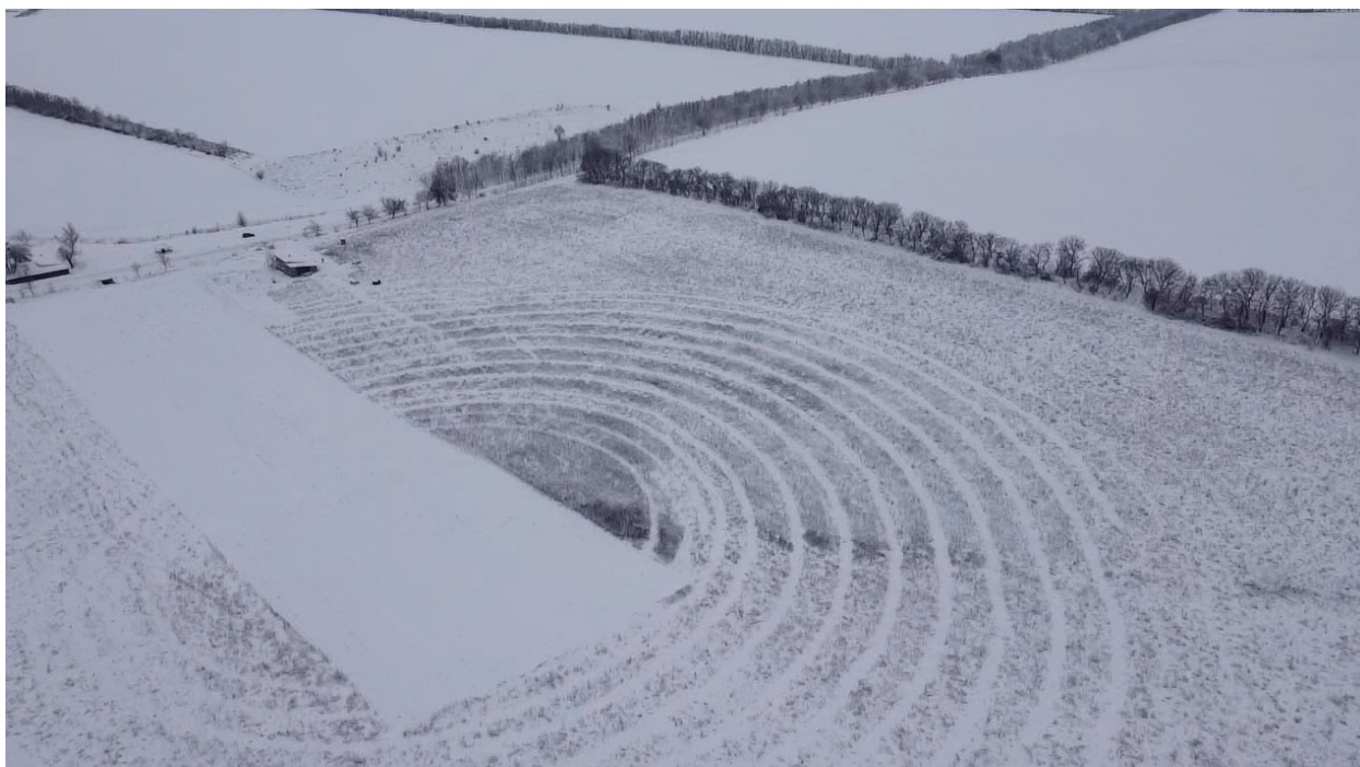
Foto 2. Imagine cu drona, iarna.