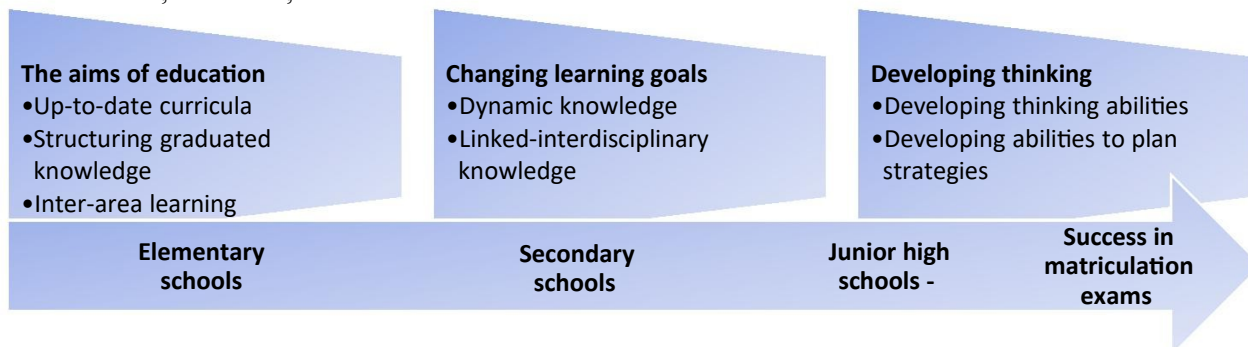
Figura 2. Principii cheie pentru modelul educațional israelian

Filiala Muncii, părinții din sectorul terț) în determinarea curriculei și consultarea procesului de implementare a acestora. Accentul este pus pe aspectul rezultatului și, în acest scop, toate sistemele sunt auto-direcționate. Aceste direcții se reflectă în reglementări, stabilirea obiectivelor de realizare, și mai ales cuantificarea educației în produse numerice (note, evaluări numerice). Figura 2 prezintă conceptul de dezvoltare al curriculei și abilităților în Israel.