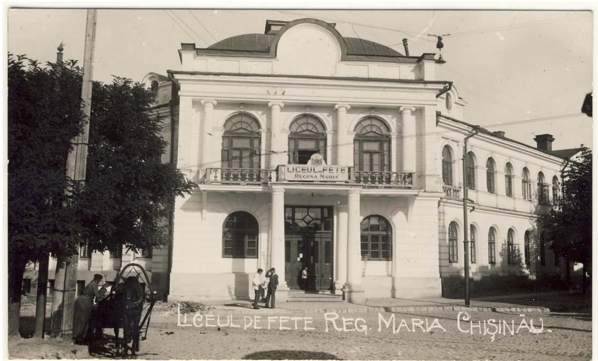
Figura 2. Liceul de Fete „Regina Maria”, Chișinău, inv. 16643, Biblioteca Națională a României