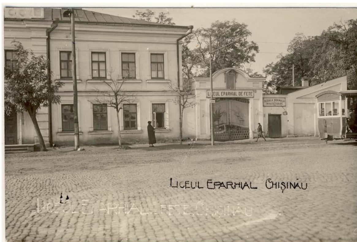
Figura 8. Liceul Eparhial de Fete, Chișinău, inv. 19092, Biblioteca Națională a României