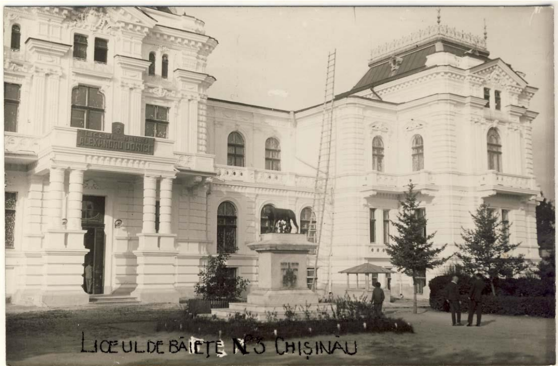
Figura 9. Liceul de băieți Nr. 3 „A. Donici”, Chișinău, inv. 19032, Biblioteca Națională a României