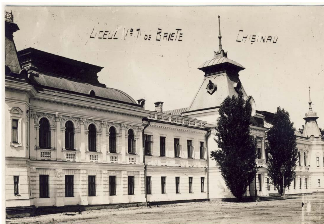
Figura 6. Liceul de Băieți Nr. 1 Chișinău, inv. 19047, Biblioteca Națională a României