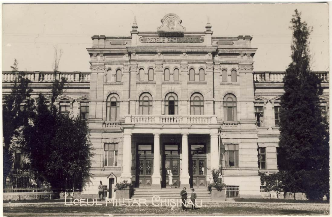
Figura 4. Liceul Militar „Regele Ferdinand”, Chișinău, inv. 19037, Biblioteca Națională a României