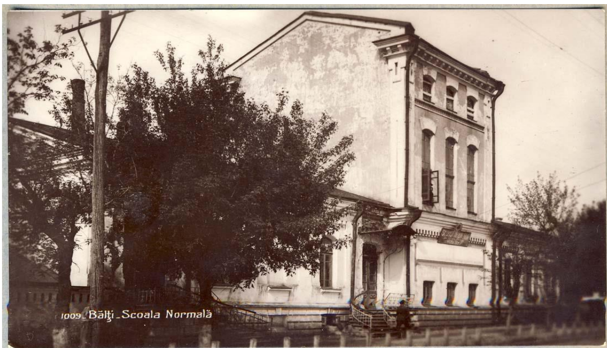
1009 Bălți Școala Normală