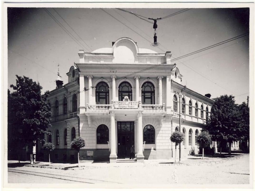
Figura 3. Liceul de Fete „Regina Maria”, Chișinău, inv. 16644, Biblioteca Națională a României