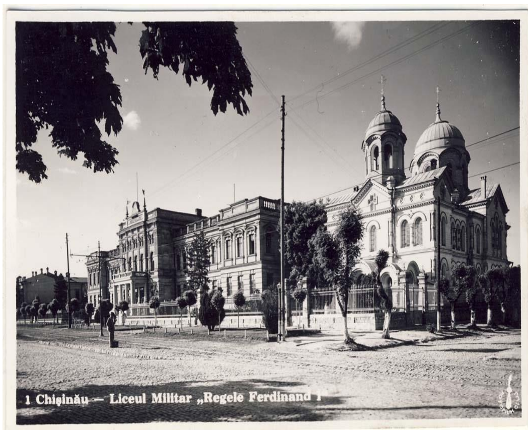
Figura 5. Liceul Militar „Regele Ferdinand”, Chișinău, inv. 19039