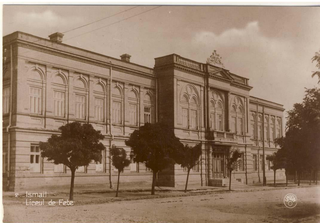
Figura 18. Liceul de Fete, Ismail, inv. 19416, Biblioteca Națională a României