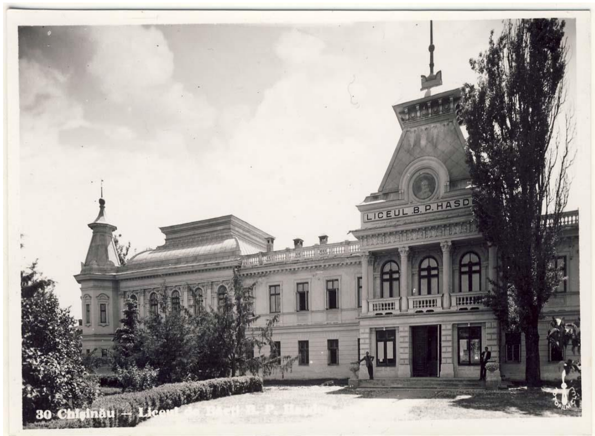
Figura 10. Liceul de Băieți „B.P. Hașdeu”, Chișinău, inv. 19036, Biblioteca Națională a României