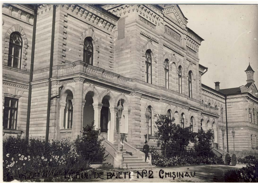
Figura 7. Liceul de Băieți Nr. 2, „M. Eminescu” Chișinău, inv. 19046, Biblioteca Națională a României