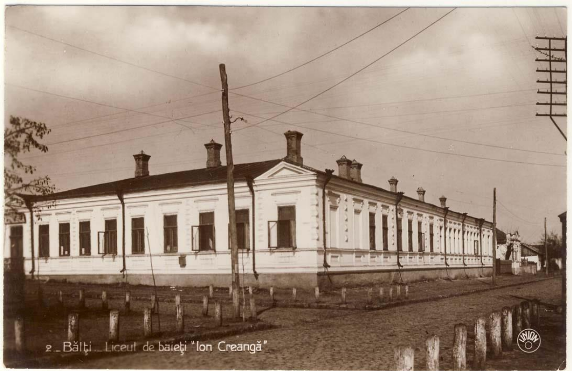
Figura 1. Liceul de băieți „Ion Creangă”, Bălți, inv. 16439, Biblioteca Națională a României