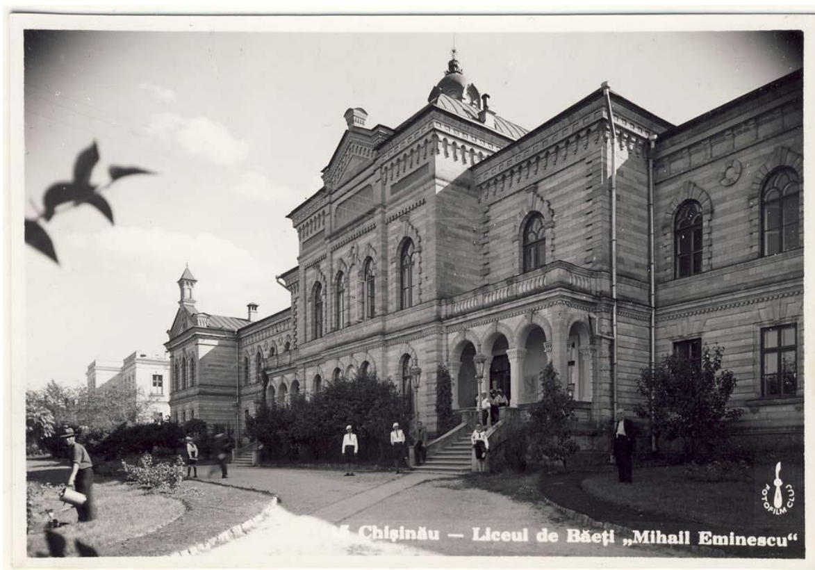
Figura 12. Liceul de Băieți „Mihail Eminescu”, Chișinău, inv. 19035