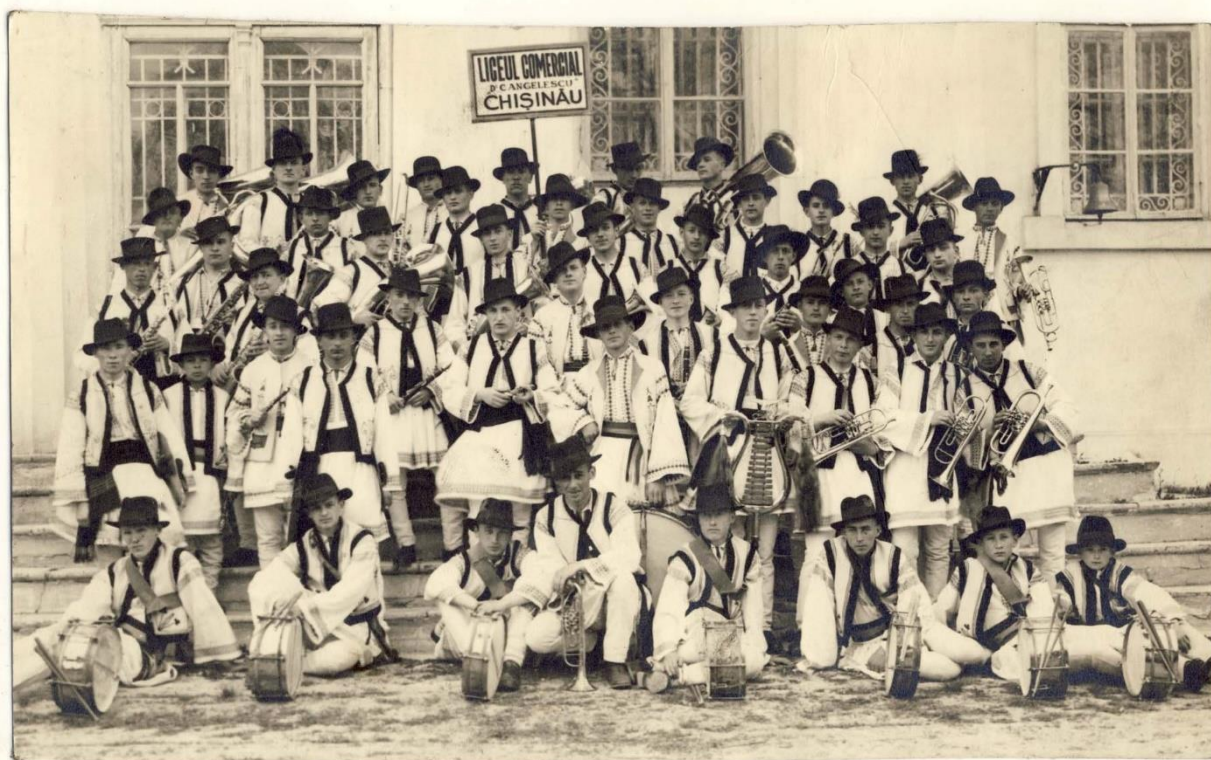
Figura 15. Fanfara Liceului Comercial "D. C. Angelescu", Chișinău, inv. 57949, Biblioteca Națională a României