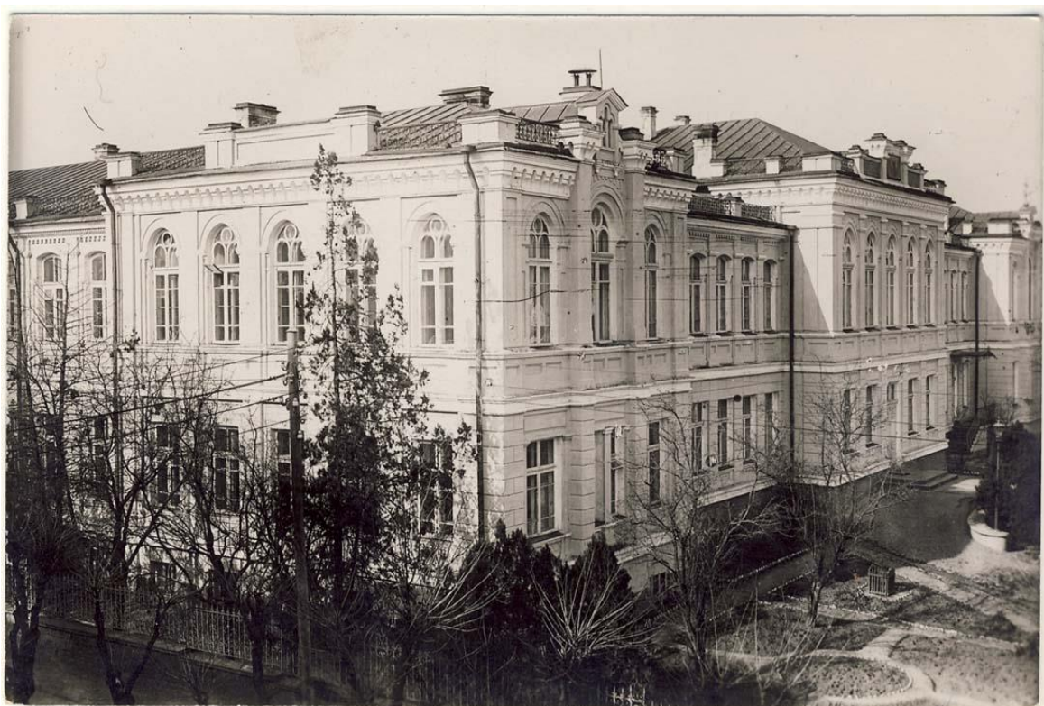
Figura 16. Liceul de băieți Nr. 4 „A. Russo”, Chișinău, inv. 19048