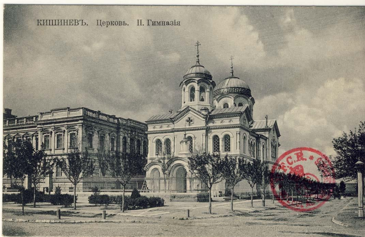
КИШИНЕВЪ. Церковь. II. Гимназія