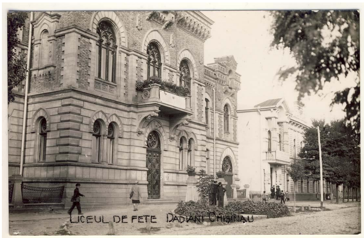
Figura 11. Liceul de Fete „Principesa Dadiani”, Chișinău, inv. 19094, Biblioteca Națională a României